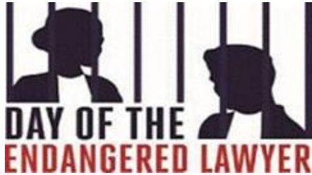
Day of the Endangered Lawyer

À l'occasion du trentième anniversaire des Principes de base des Nations Unies relatifs au rôle du barreau et compte tenu de ce qui précède, le CCBE et toutes les organisations signataires appellent donc à une application plus effective des garanties fournies par les Principes de base des Nations Unies relatifs au rôle du barreau et réitère son soutien ferme aux travaux menés par le Conseil de l'Europe pour une future Convention européenne sur la profession d'avocat, considérant qu'un tel instrument contraignant spécifique est nécessaire afin de préserver l'indépendance et l'intégrité de l'administration de la justice et l'état de droit.