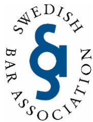
Suède – Swedish Bar Association