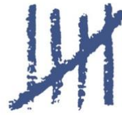
BAR HUMAN RIGHTS COMMITTEE OF ENGLAND & WALES